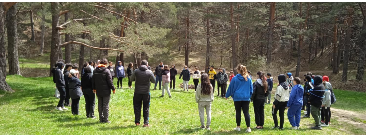
Salida de primavera adolescencia 2023