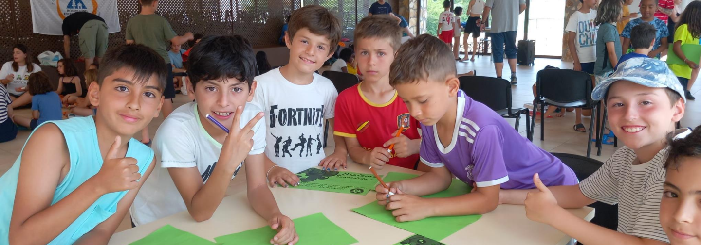
Campamento de verano infancia 2023